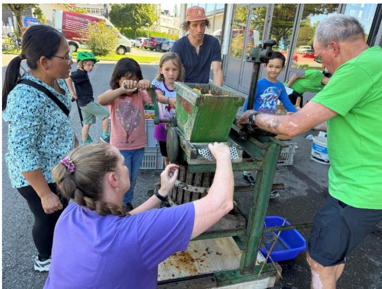
Bild: Tag des Apfels mit Mostpresse, Hochfelden