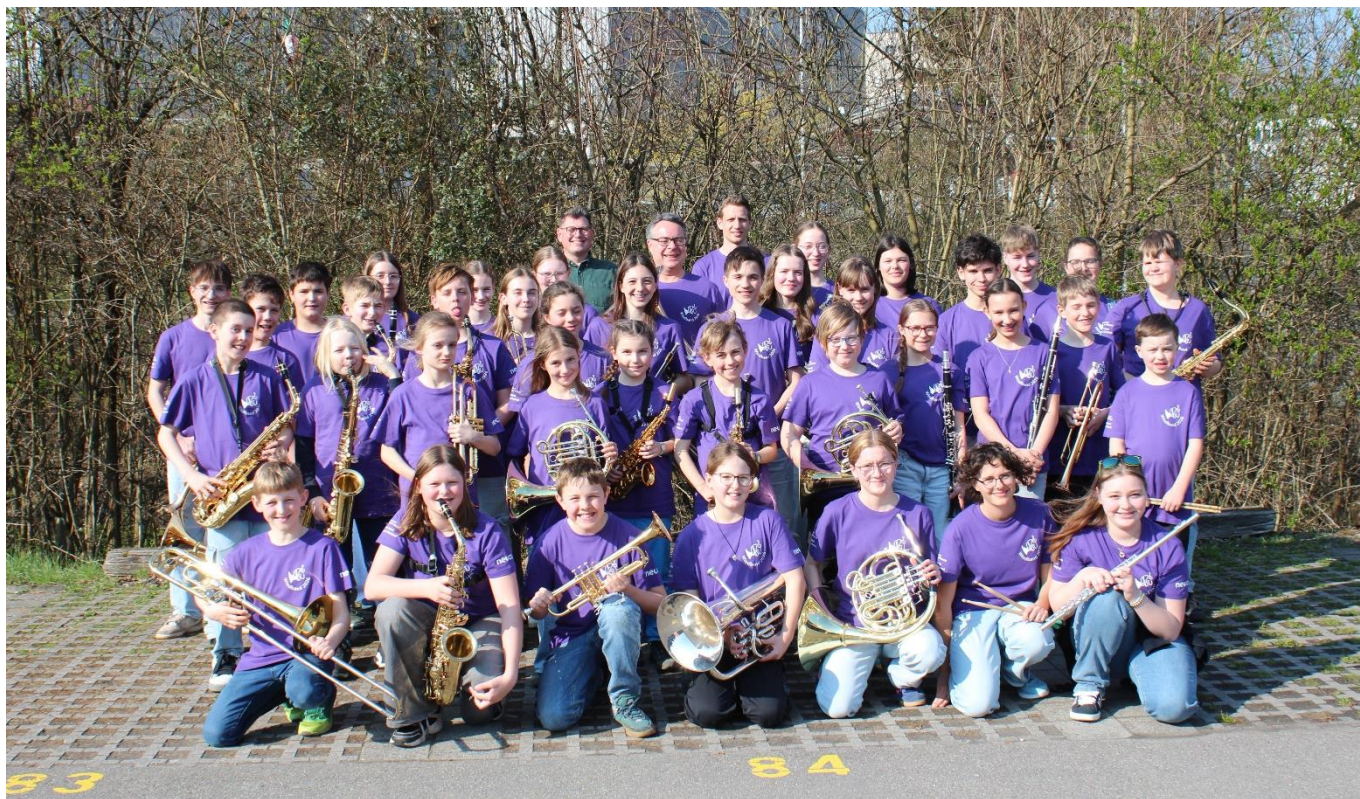
Bild: Die Windband 2026 mit rund 40 Jugendlichen zwischen 8 und 17 Jahren